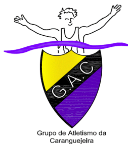
Grupo de Atletismo da Caranguejeira